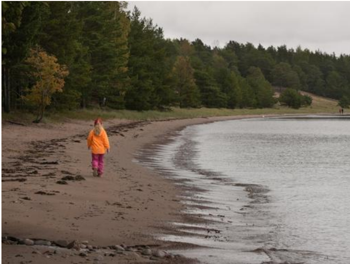
Rannan hiekka on tasainen ja mukava alusta lenkkeilijälle.

Lappohjanrannan alue on luonnonsuojelullisesti merkittävä monipuolisen kasvillisuuden ja hiekkadyynien vuoksi, ja se on osa EU:n Natura 2000 -suojelualueverkostoa.