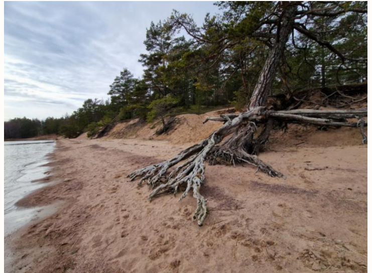
Vuosien saatossa puiden juuriston ympäriltä on hiekka valunut pois.