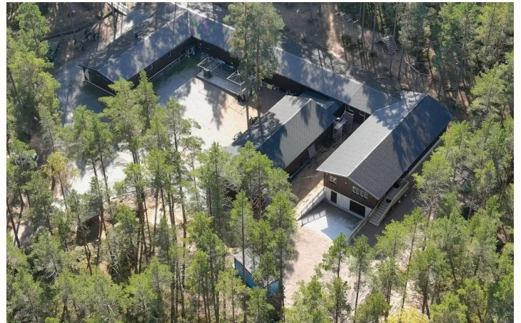
Hankoniemen Rintamamuseolla on näyttelytilojen lisäksi ulkoalueella tykkejä ja pansarivaunu, opastettu sotapolku sekä muistokorsu.

Hankoniemen Rintamamuseo ylläpitää Bunkkerimuseo Irmaa. Bunkkeri on osa Harparskogin puolustuslinjaa ja sijaitsee noin viiden kilometrin päässä Rintamamuseosta.