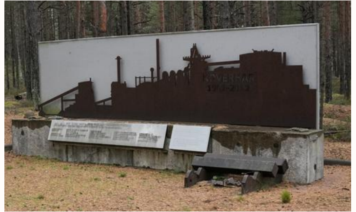
Koverharin terästehdas ajautui konkurssiin 2012. Tehtaan muistomerkki löytyy Koverharintien varrelta. Suunnittelija Heikki Kukkonen.

Koverharin terästehdas aloitti toimintansa marraskuussa 1961, tehtaan toiminta päättyi 2012.